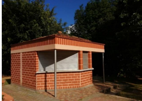
Foto registro espacio destinado para La Tienda Comunitaria URA_RedBioCol

producciones a fines a la promoción de la agroecología y producción limpia en articulación campo ciudad.