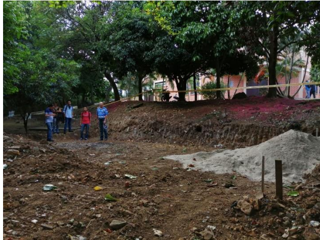
Foto registro Zona Piloto Sistema de Compostaje URA

Para contexto de la comunidad se tiene una propuesta de fase inicial para el tratamiento inicial de residuos orgánicos dentro de la Urbanización.