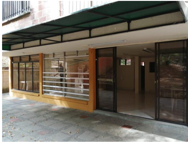
Foto registro Salón Social Área proyectada para la Logística del Mercado Comunitario URA_RedBioCol

Se proyecta el Salón Social de la URA como un espacio posible para la realización de este ejercicio de economía alternativa, dado que cumple con las características físicas adecuadas para la logística requerida del Mercado Comunitario.