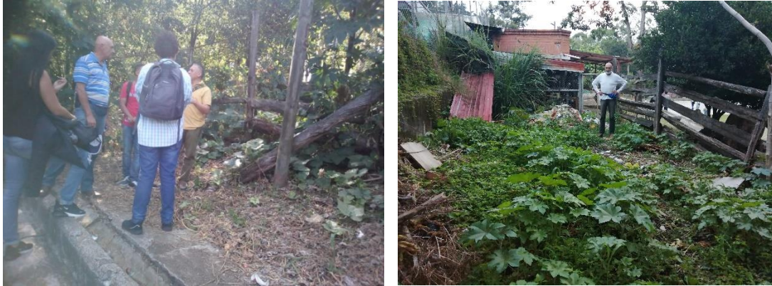
Fotos registro espacio destinado para El Vivero Comunitario URA

aprovisionamiento de la Tienda, para los ejercicios comunitarios, como para proveer la huerta urbana URA.